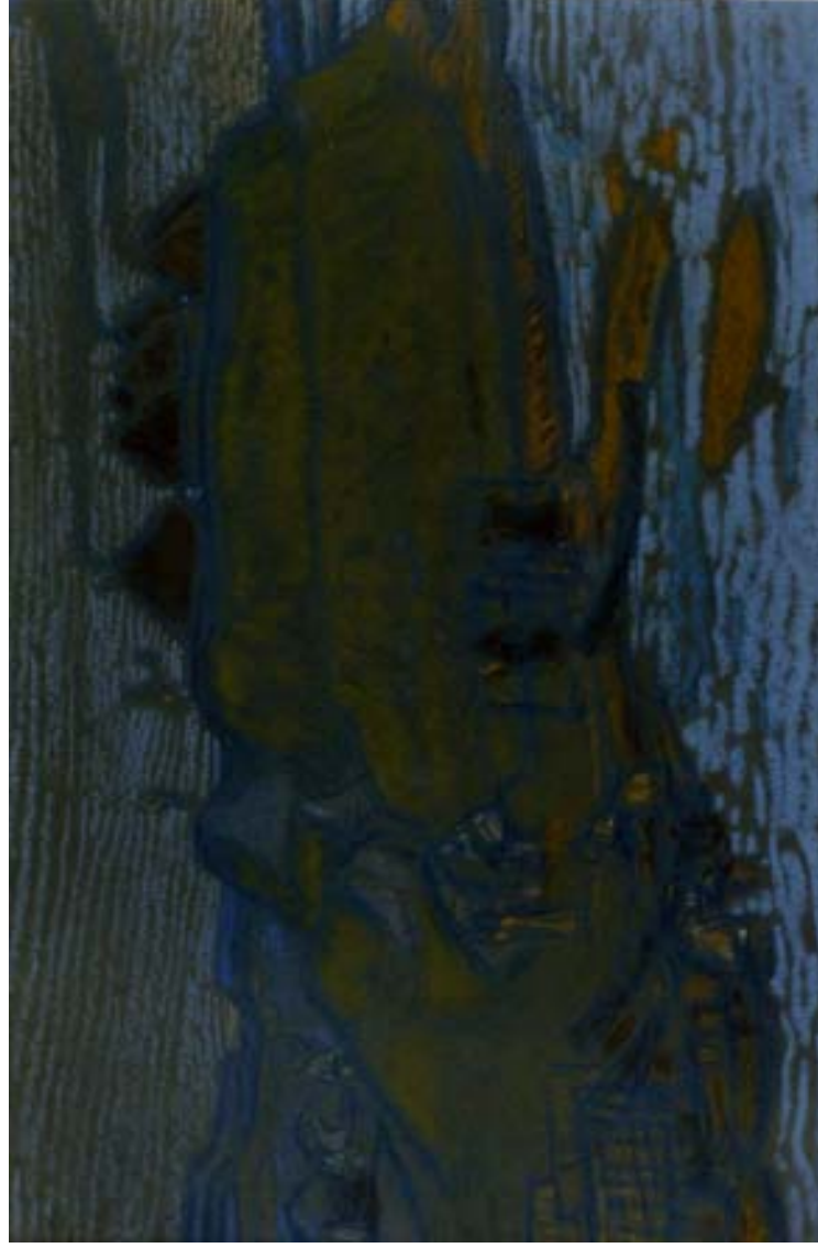
Н. К. Рерих. Собирают дань. Эскиз. 1908