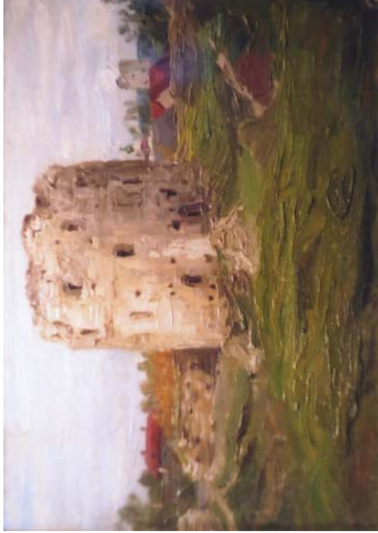
Н. К. Рерих. Разрушенная башня псковской стены. Этюд. 1903