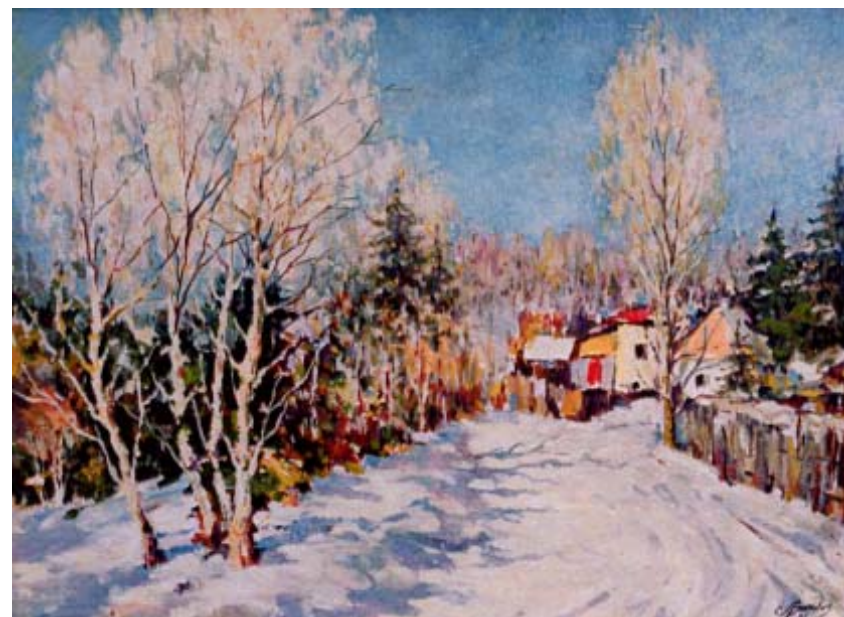
2. Зимнее утро. 1993

Одесский Дом-Музей им. Н. К. Рериха, 2006