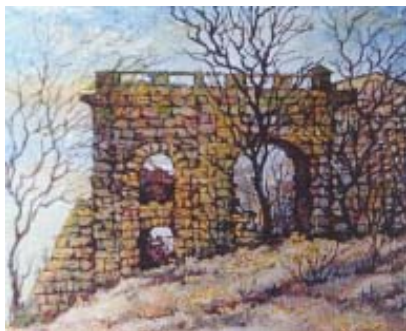
27. Остатки старой мечети. 1992 Б., акв. 24x30 Выставки: Музей Одесского морского торгового порта, 1996 Музей Западного и Восточного искусства, 1999 Морская галерея, 2000 Одесский Дом-Музей им. Н. К. Рериха, 2006