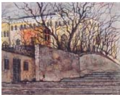
25. На Ланжероновском спуске. 1994 Б., акв. 24x30 Выставки: Музей Одесского морского торгового порта, 1996 Морская галерея, 2000 Одесский Дом-Музей им. Н. К. Рериха, 2006