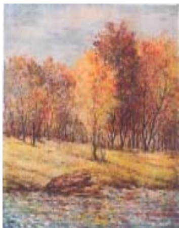
26. Уголок дендропарка. 1993 Б., акв. 30x24 Выставки: Музей Одесского морского торгового порта, 1996 Морская галерея, 2000 Одесский Дом-Музей им. Н. К. Рериха, 2006