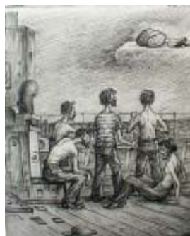
39. Рисунки к повести «Необыкновенный рейс «Юга»». 1995