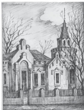
37. На 16-й ст. Б. Фонтана. 1992