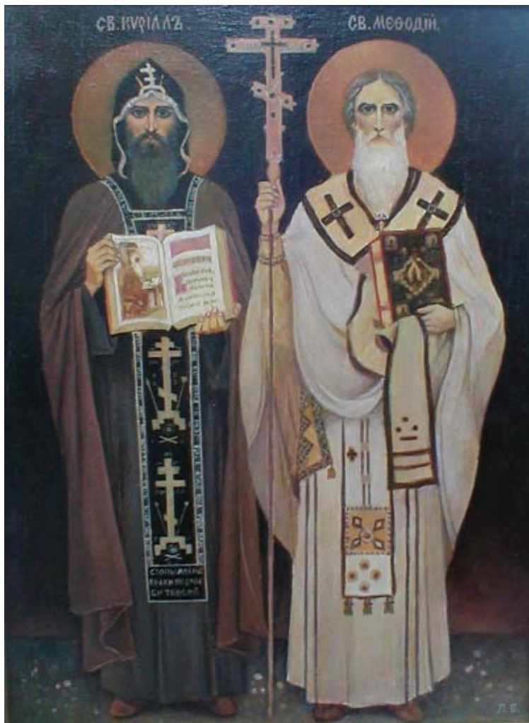
1. Просветители славянства св. Кирилл, св. Мефодий. 2004