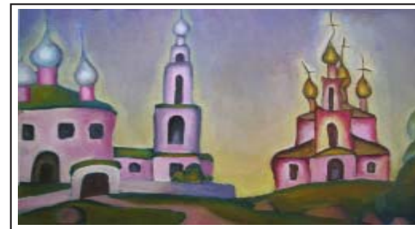
Цикл “Храмы и монастыри” (1925 - 1957)