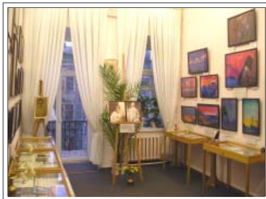
Одесский Дом - Музей им. Н. К. Рериха. Интерьер комнаты семьи Рерихов

В экспозиции представлены редкие издания книг Семьи Рерихов, малые скульптурные формы и иконы (танки) буддизма и индуизма. Представлена православная икона. В фондах музея хранится более тысячи различных экспонатов.