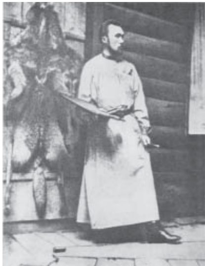
Н. К. Рерих за работой в Изваре. 1890-е гг. Фото

ках, подчёркивая яркость детских впечатлений и как было «важно приехать в Извару» [14, с. 97]. В одном из очерков Рерих писал, что в Изваре «собраны волчьи и рысьи меха» – охотничьи трофеи, которые пригодились в устраиваемой художественной мастерской: «из старого птичника переделана мастерская» [15, с. 99].