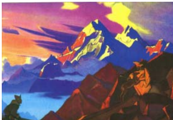
Н. К. Рерих. «Сострадание». 1935–1936 гг.

В 1935–1936 годах Н. К. Рерих пишет картину «Сострадание». В этой картине художник изобразил высшие нравственные достижения человека – милосердие и сострадание. Эту картину можно рассматривать и как автобиографическую. Возможно, что в образе