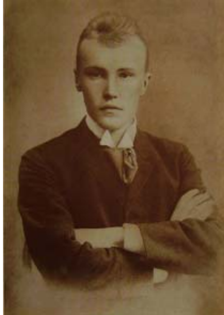
Н. К. Рерих-студент. 1896г. Фото

Впервые публикуется письмо-автограф Н. К. Рериха – выдающегося художника, мыслителя, писателя, археолога, путешественника – к скульптору В. А. Беклемишеву (1861–1920). В этом письме, написанном в стиле грамоты, открывается увлечение Рериха охотой. Многие биографы художника писали об этом увлечении юного Рериха, в частности, П. Ф. Беликов (1911–1982) и В. П. Князева (1926–2004) в книге «Рерих» серии «Жизнь замечательных людей» (1972).