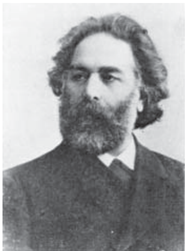
А. И. Куинджи. 1898 г. Фото

проскребку наведёт он золотые звёзды на небо или лучи», – пишет Рерих в очерке «Иконный терем» [22, с. 41].