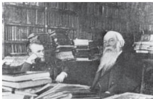
Н. К. Рерих и В. В. Стасов в Публичной библиотеке. Вторая половина 1890-х гг. Фото

ве. А В. В. Стасов не мог и предположить, призывая студента Рериха «ни до каких курков и зарядов больше никогда не дотрагиваться», что это станет