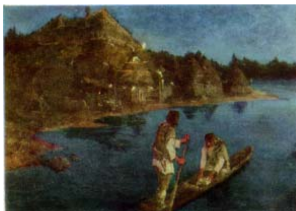
Н. К. Рерих. «Гонец. Восста род на род». Масло. 1897г.

В 1893 году Н. К. Рерих написал литературный этюд «По реке с лучом». Этюд напечатан 13 июля 1893 года в журнале «Звезда». Как это описание созвучно настроению картины «Гонец»! «Я занимаю мое обыкновенное место на руле, лесник – у весел, и Михаил Иванович – с острогой. Незаметно двигается лодка. Весла работают почти без шума. <...> Вот лодка идет подле берега; точно панорама движутся перед нами обросшие лесом берега» [27, с. 23–24].