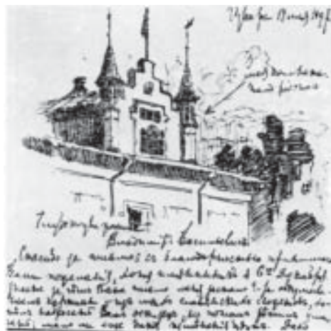
Имение Извара. Рисунок Рериха в письме В. В. Стасову. 1897 г.

часто прерывали школьные занятия. После третьего класса доктор настоятельно рекомендовал как самое радикальное для закалки здоровья средство зимние и весенние охоты» [1, с. 14]. В Царскосельском уезде Санкт-Петербургской губернии у родителей Рериха было имение Извара (мыза Извара). В окрестностях Извары Рерих проводил археологические раскопки и охотился. Так, в очерке «Археология» Рерих писал: «Около Извары почти при каждом селении были обширные курганные поля от X века до XIV. От малых лет потянуло к этим необычным странным буграм, в которых постоянно находились занятные металлические древние вещи» [9, с. 106]. А в очерке «Охота» Н. К. Рерих вспоминал: «Уже со школьных лет обнаружались всякие легочные неполадки. Затем они перешли в тягостные долгие бронхиты, в ползучие пневмонии, и эти невзгоды мешали посещению школы. <...> Наконец, после третьего класса гимназии домашний доктор серьезно задумался и решил радикальный исход. “Нужно и зимою ездить в деревню, пусть приучается к охоте. В снегах и простуду как рукой снимет”. <...> По счастью, этот врачебный совет был исполнен. В это время управляющим в Изваре был Михайло Иванович Соколов, почти что Топтыгин по виду и по своей любви к охоте и лесу» [13, с. 104].