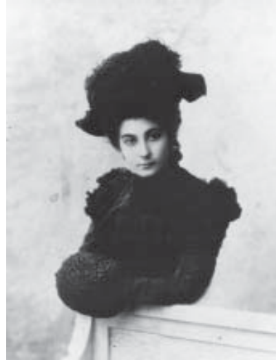
Е. И. Рерих. 1900 г. Фото